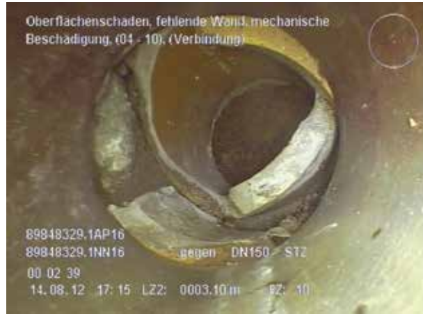
Defekte Leitung – Fehlende Wand

Undichte Abwasserkanäle auf privaten Grundstücken können durch Eindringen von Grundwasser zu einem erhöhten Anteil „Fremdwasser“ und damit zu Problemen bei der Abwasserableitung und -reinigung führen. Ebenso ist ein Austritt von Abwasser und dadurch eine Schadstoffbelastung von Boden und Grundwasser möglich. Unter Umständen sind damit sogar Gefahren für die öffentliche Trinkwasserversorgung verbunden.