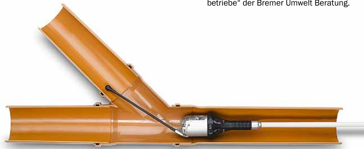
Zustandserfassung mit der Dreh-/Schwenkkopfkamera IBAK Orion L („Kieler Stäbchen“)

Gefördert werden 35 Prozent der entstandenen Kosten, höchstens jedoch ein Betrag in Höhe von 250,- Euro je Zuschussempfänger.